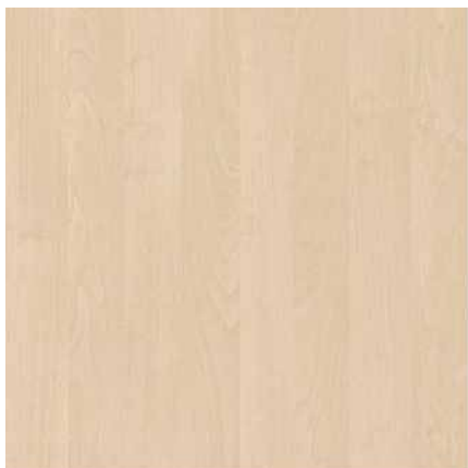
Dekor světlé dřevo - bříza (např. 1715)